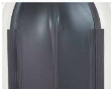
3 zusätzliche Scheuerleisten