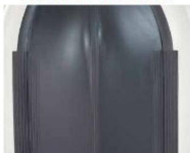
3 zusätzliche Scheuerleisten