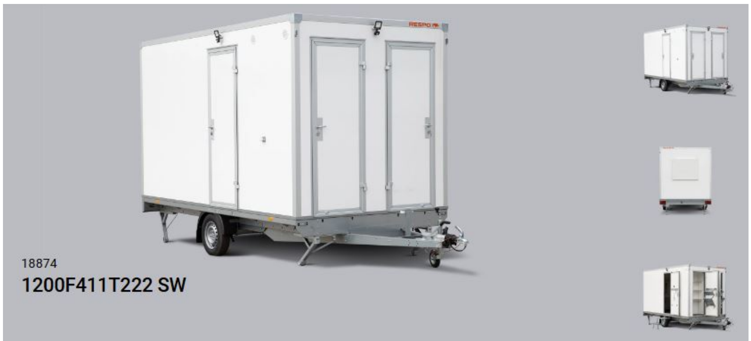
18874 1200F411T222 SW