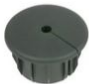
Garmin Marine Netzwerk