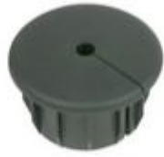
Garmin Marine Netzwerk